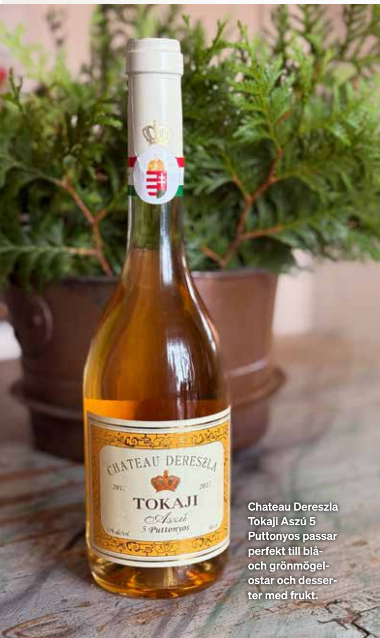
Chateau Dereszla Tokaji Aszú 5 Puttonyos passar perfekt till blå- och grönmögel-ostar och desserter med frukt.