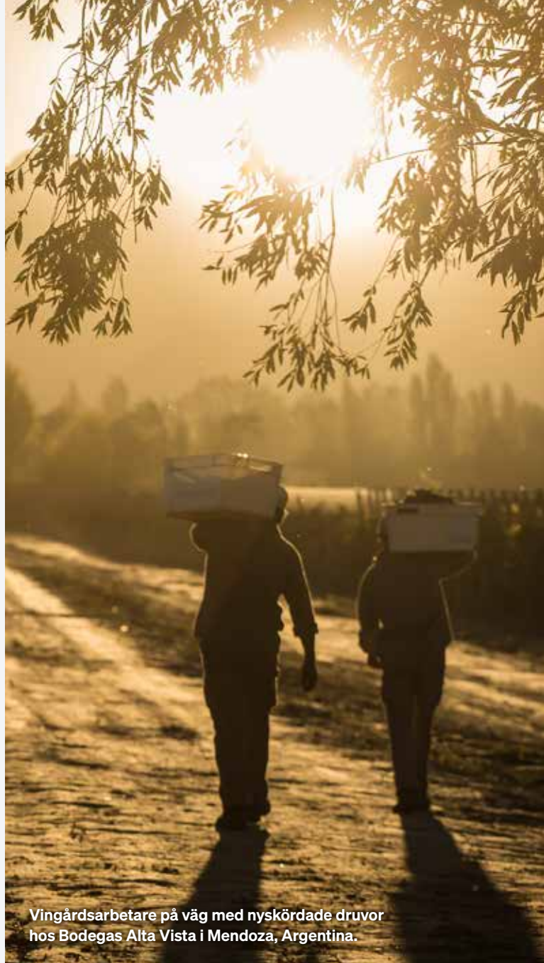
Vingårdsarbetare på väg med nyskördade druvor hos Bodegas Alta Vista i Mendoza, Argentina.